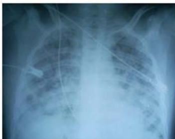
Figura 2. Radiografía al tercer día de estancia en la UCI. Existe incremento de las lesiones inflamatorias las cuales son más confluentes.

Inicialmente se consiguió mejoría, disminuyó la polipnea y se logró una PO 2 de 90 mmHg, pero tres días después el niño estaba peor. (Figuras 2 y 3 ).