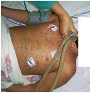
Figura 4. En el momento de ventilar mecánicamente se observa el exantema vesiculopustulocostroso típico de la varicela.

La evolución fue hacia el deterioro lento y progresivo de los parámetros pulmonares. No se presentaron signos graves de disfunción multiórgano, solo taquicardia y disminución de la diuresis (ambos controlados con dobutamina y furosemida respectivamente), así como prolongación ligera del tiempo de protrombina. La función gastrointestinal siempre estuvo conservada a pesar de su enfermedad de base. Fue necesario tratar infecciones nosocomiales por gérmenes como Escherichia coli , Klebsiella Pneumoniae , acinetobacter (sin precisarse el tipo) y Candida Albicans , los tres primeros aislados en secreciones respiratorias y el último en orina. Los antimicrobianos usados fueron: meropenem, cefipime, ciprofloxacina, ceftazidima, amikacina y anfotericina B. La situación clínica-analítica era crítica al mes de estancia en la UCI presentando una hipoxemia severa mantenida que no mejoraba con PEEP de 20 mmHg y presión de control por encima de PEEP de 50 CmH 2 O.