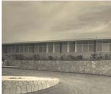
Figura 3. Entrada del Hospital “José Ramón Martínez Álvarez” después de su remodelación en 1980.

En 1965 se incrementan 100 camas más al hospital de Guanajay. En octubre de 1980 se terminó de construir el local de archivos y el Departamento de Patología y se remodelan el Departamento de Iconopatografía, local de la Unión de Jóvenes Comunistas, consulta externa y dirección, laboratorio, sala de gastro y respiratorio, salón de operaciones, sala de Cirugía y medicina de hombres, estación de enfermería, sala de Ginecología, cuerpo de guardia, cocina comedor, lavandería, caldera, morgue, almacén, salón de reuniones, oficinas administrativas y central de esterilización. En general se realiza una remodelación completa del hospital, (figura 3). (Suárez Camejo E. El Termómetro. Boletín Informativo de los Trabajadores del Hospital General de Guanajay, octubre de 1980, año 15, número 7:3-4)