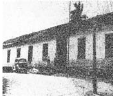
Figura 2. Imagen exterior del antiguo Hospital Civil "San Rafael" de Guanajuato que se encontraba en los primeros años de 1950 en completo estado de ruinas.

En los primeros años de la década de 1950 el hospital "San Rafael" se encontraba ya prácticamente en ruinas. (figura 2)